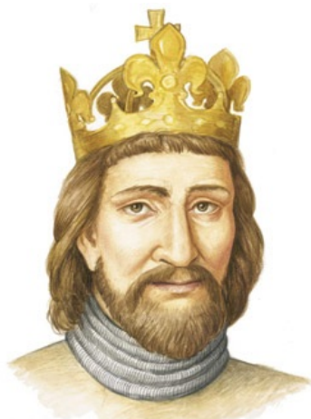
(c) Jiřina Lockerová - nakladatelství Fragment

Leta 1273 je bil za nemškega cesarja izvoljen Rudolf Habsburški. Ta je premagal Otokarja in postal deželni knez Kranjske, Koroške in Štajerske.