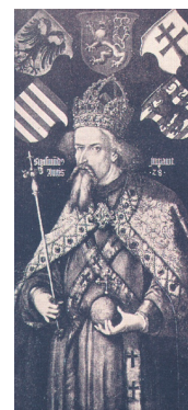
Ogrski kralj in kasnejši nemški cesar Sigismund Luksemburški.

V bitki proti Turkom pri Nikopolju Herman II. reši Sigismunda, takratnega kralja Ogrske pred turškim zajetjem.