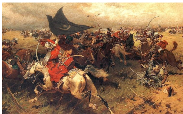
Bitka pri Nikopolju 1369

V bitki proti Turkom pri Nikopolju Herman II. reši Sigismunda, takratnega kralja Ogrske pred turškim zajetjem.