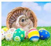
To je zajček.