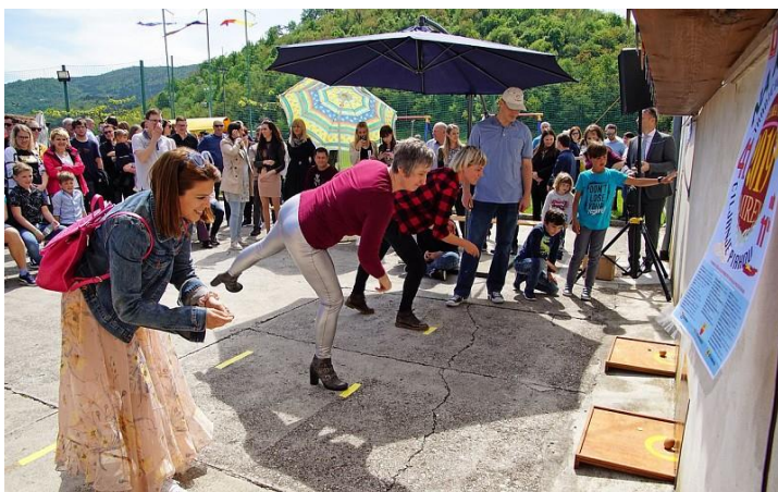
Ciljanje pirhov s kovanci.

Za veliko noč si ljudje voščijo vesele velikonočne praznike.