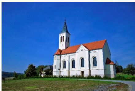
To je cerkev. Ljudje odnesejo košare z dobrotami v cerkev.