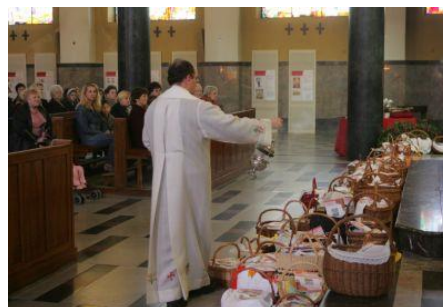
Blagoslov jedi v cerkvi.