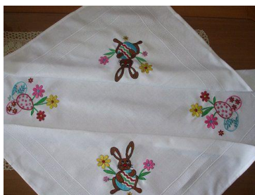
To je prtiček. Prtiček je majhen prt.