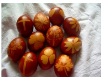
To so PIRHI ali PISANICE. Pirhi so barvana kuhana jajca.