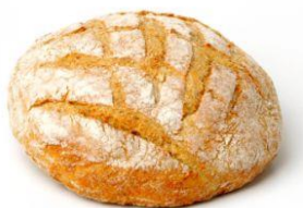
To je kruh. Doma spečemo kruh.