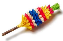
To je butara. Butara je pisana.

Simbol velike noči so butare, zajčki in piščančki. Danes imajo otroci radi tudi čokoladna velikonočna jajca s presenečenjem.