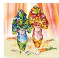
To so čokoladna jajca. V jajcih je presenečenje.