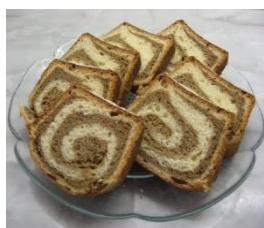
To je potica. Potico pečemo za veliko noč.