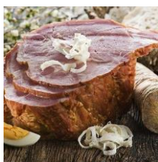
To je šunka. Šunka je svinjsko meso.