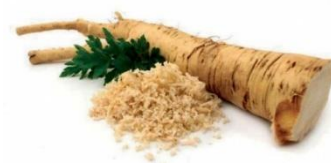
To je hren. Hren je grenkega okusa.