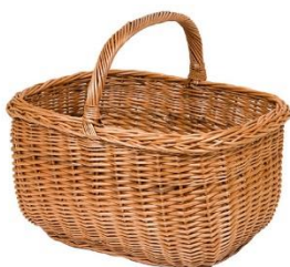
To je košara. V košaro damo jedi.

Na veliko soboto se blagoslovijo jedi (pogovorno rečemo žegnajo). Gospodinje pripravijo tradicionalne velikonočne jedi: pisana jajca (pirhi), šunka, hren in potica. Jedi dajo v košaro. Košaro pokrijejo s prtičkom. Na ta dan nesejo ljudje polno košaro jedi v cerkev.