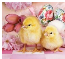
To je piščanček.