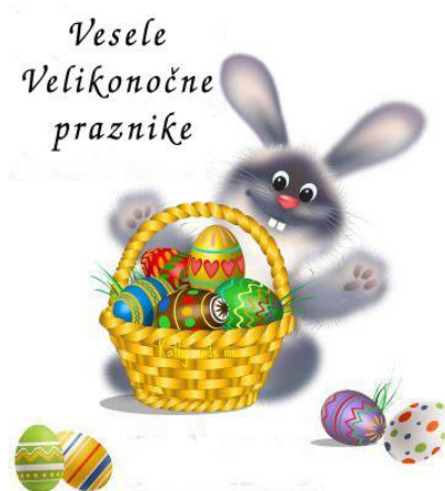
To je voščilo.