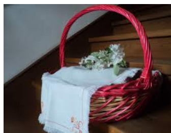
Košaro pokrijemo s prtičkom.