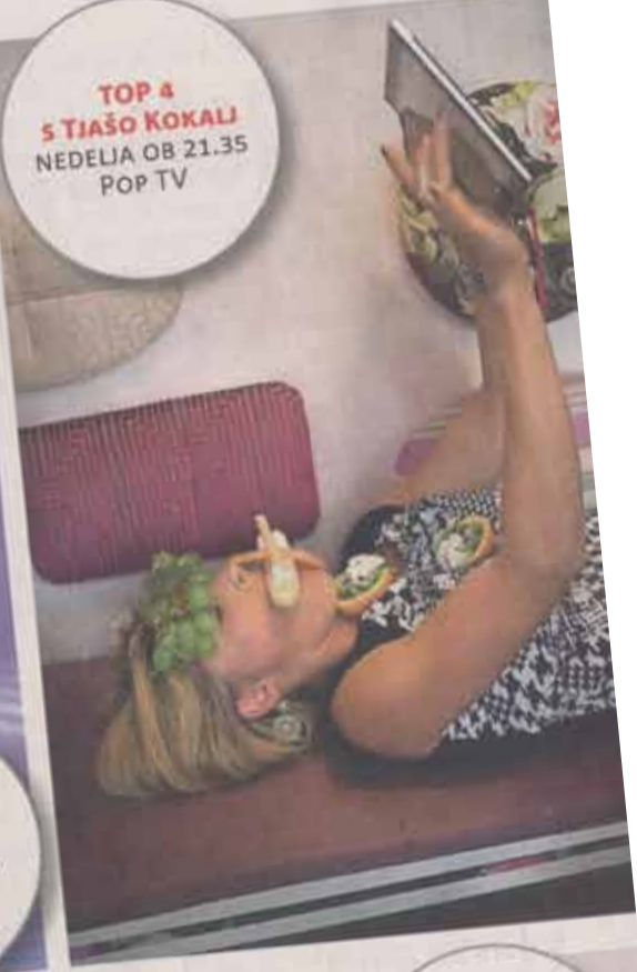
TOP 4 S TIAŠO KOKALI NEDELJA OB 21.35 POP TV