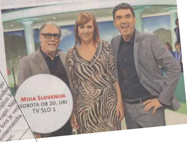
MOJA SLOVENIJA SOBOTA OB 20. URI TV SLO 1