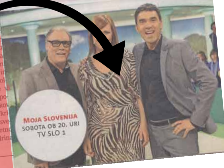
MOJA SLOVENIJA SOBOTA OB 20. URI TV SLO 1