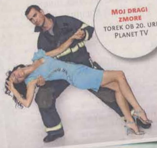
MOJ DRAGI ZMORE TOREK OB 20. URI PLANET TV