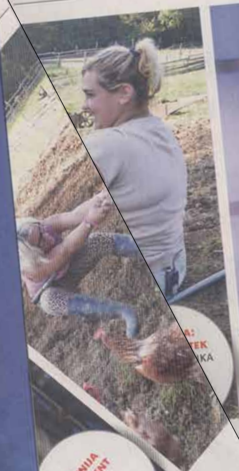
SLOVENIJA IMA TALENT NEDELJA OB 20. URI POP TV