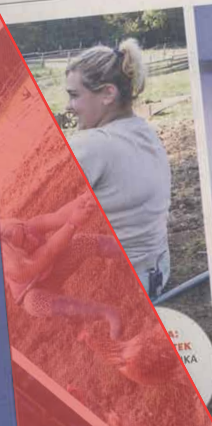
SLOVENIJA IMA TALENT NEDELJA OB 20. URI POP TV