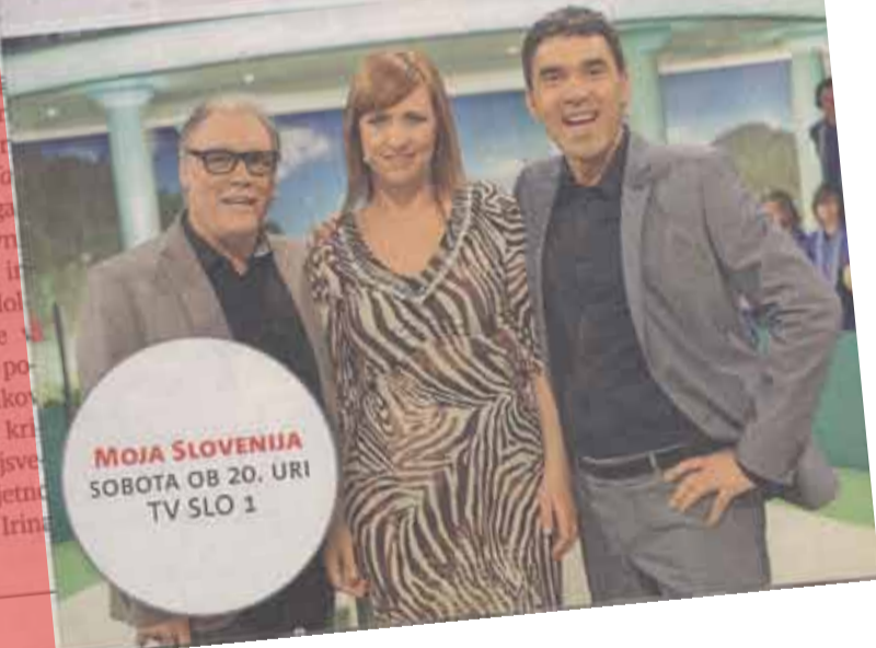
MOJA SLOVENIJA SOBOTA OB 20. URI TV SLO 1