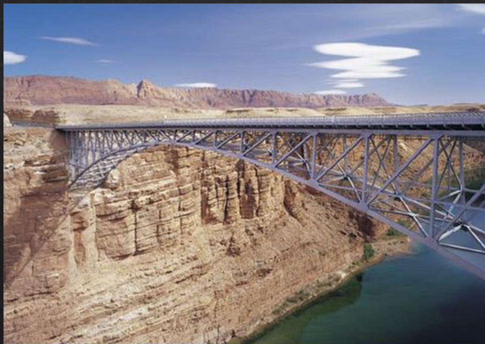
Navajo Bridge - Marble Canyon, Arizona