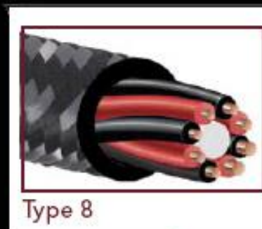
Type 8 Circular Array