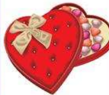
die Bonboniere, -n