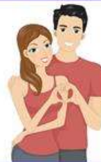
das Liebespaar, -e