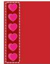
die Grußkarte, -n