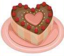
die Herztorte, -n