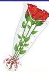
die Rose, -n