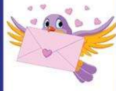
der Liebesbrief, -e