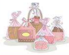
das Geschenk, -e