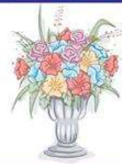
der Blumenstrauß, -"e