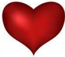
das Herz, -en