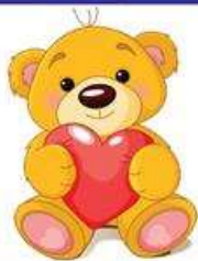
das Plüschtier, -e