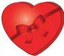
die Pralinschachtel, -n