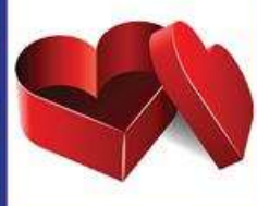
die Herzbox, -en