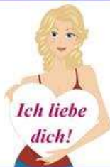
die Liebeserklärung, -en