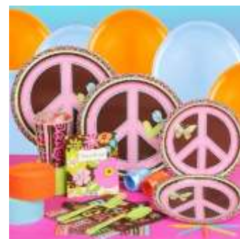
Znak za MIR

Odsev uporabe drog= halucinogeno videnje.