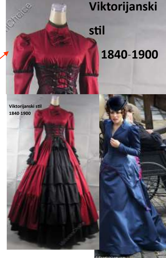
Viktorijanski stil 1840-1900