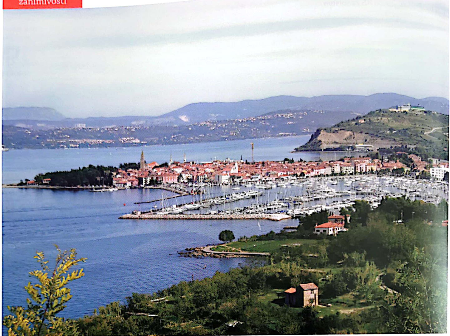
Slika 1: Izola, nekdanje središče slovenskega ribištva.

Izola je svoj ribiški značaj dobila že leta 1881, ko so v mestu postavili prvo predelovalnico rib, ki je bila v okviru francoske družbe iz Pariza. Izdelovali so tako ribje konzerve kot tudi konzerve druge hrane. Tovarna je večkrat menjala ime, a jo tako iz preteklosti kot tudi še danes poznamo pod imenom Delamaris, le da je danes del matičnega podjetja Pivka perutninarstvo d.d. s sedežem v Pivki.