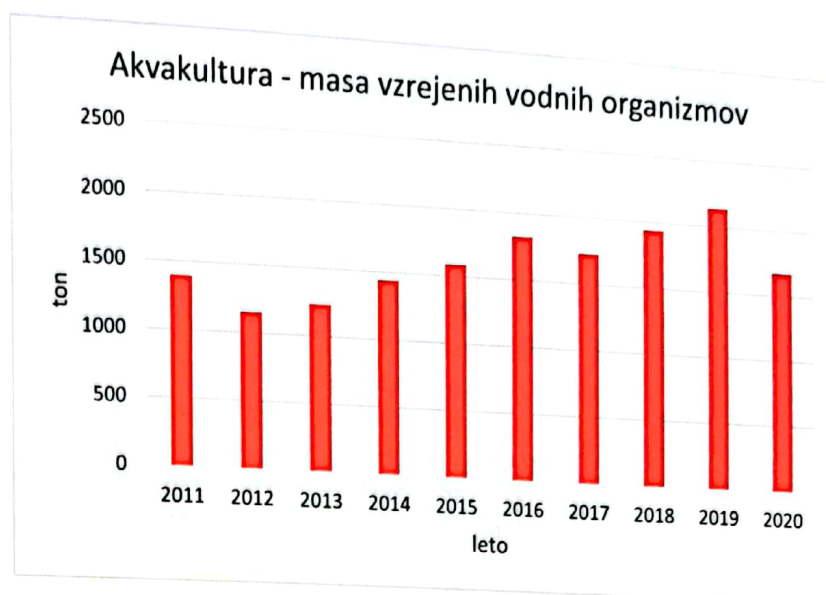
Grafikon 3: Masa vzrejenih vodnih organizmov v akvakulturi v Sloveniji med letoma 2011 in 2020

Sklenemo lahko, da je slovensko ribištvo tako na morju kot sladkih vodah zadnja desetletja doživelo precejšen pretres. Zlasti ulov morskih rib se je s prestrukturiranjem slovenske ribiške industrije močno zmanjšal, rečemo lahko kar