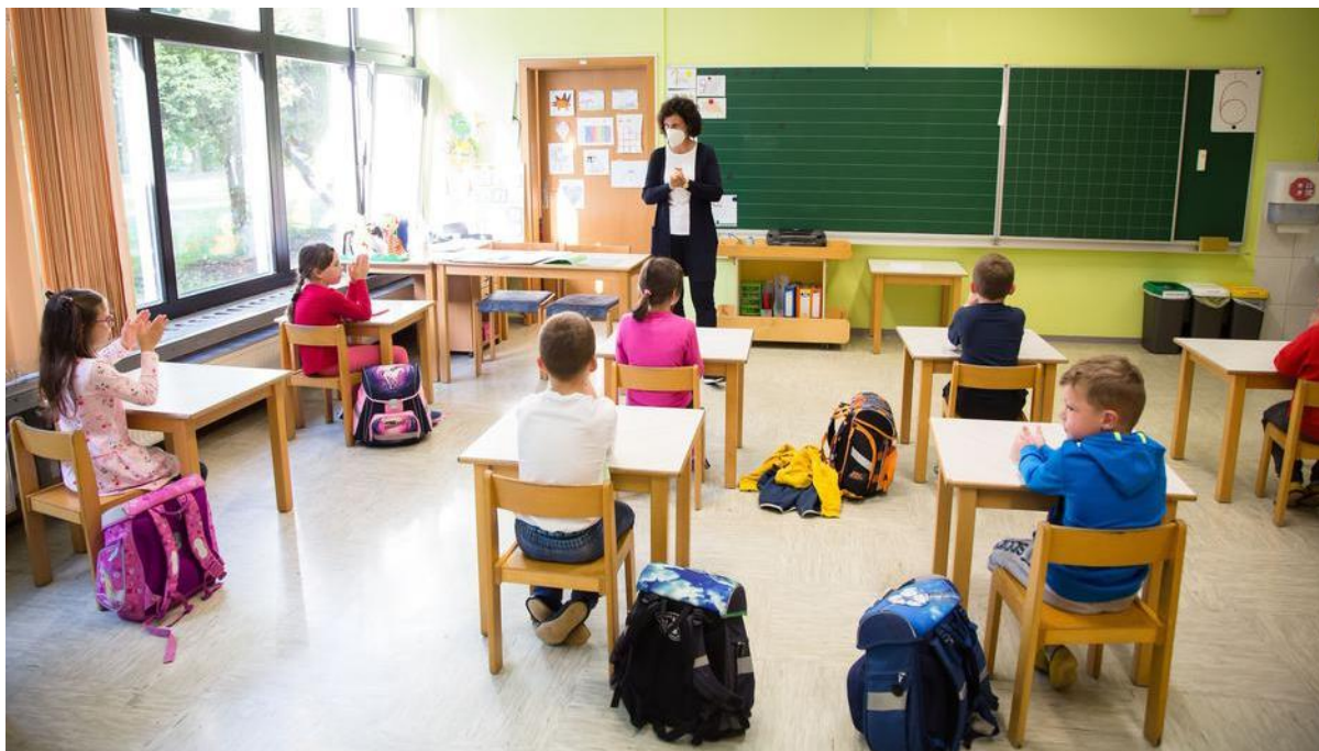
FOTO VEST je vest, ki je sestavljena iz skrbno zbrane fotografije, ki nekaj predstavlja (npr. trgatev v Slovenskih goricah, zimske radosti na snegu) pod njo pa je kratek podnaslov (podnapis), ki nam pove, kaj fotografija predstavlja (kaj se je zgodilo).

Učenci 1.–3. razreda se v tem tednu vračajo v šolske klopi.