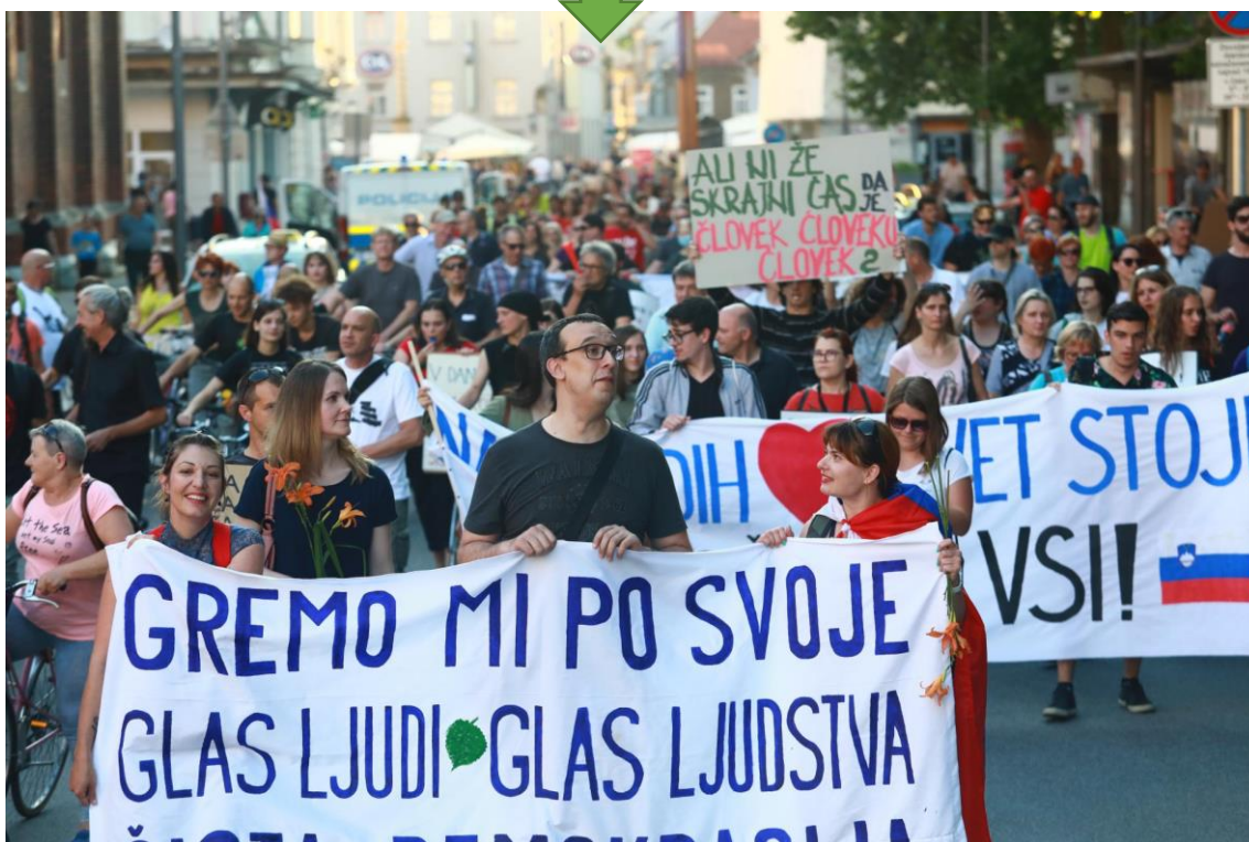
Množični petkovi protesti v slovenski prestolnici

Že sama fotografija, ki jo izberemo, nam sporoča, za katero vrsto dogodka gre.