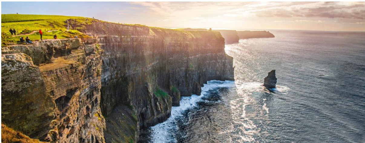
Klif (Clifs of Moher; Irska). ( https://www.paddywagontours.com/CLIFFS-OF-MOHER-Day-Tour-From-DUBLIN ; 18. 1. 2021)