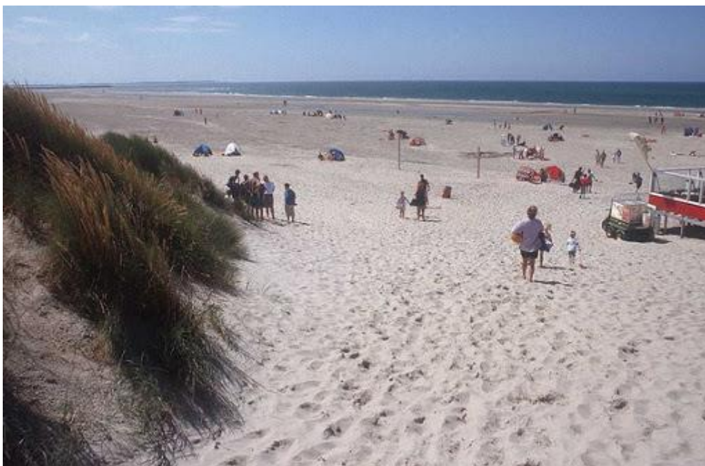
Nizka, peščena obala na Nizozemskem.

( http://www2.arnes.si/~jdobaj/zgodovina/geografija/7geografija/Zahodna_Evropa/Besedilo_vpliv%20morja.htm ; 18. 1. 2021)