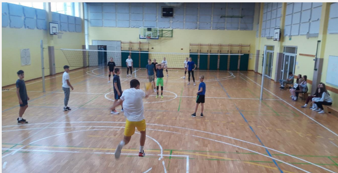
Tekma med učenci in učenkami devetih razredov (17. 11. 2022)