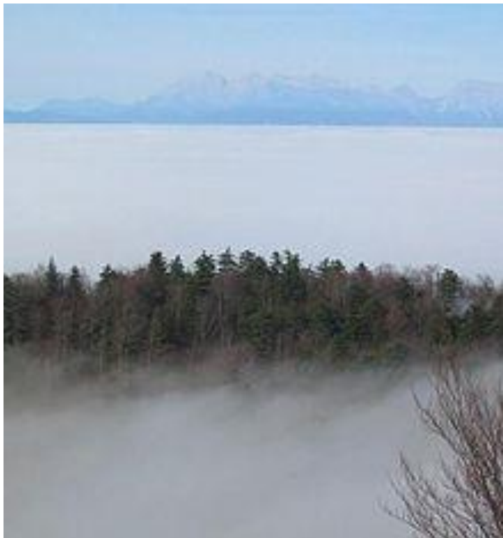
Temperaturni obrat v Ljubljanski kotlini