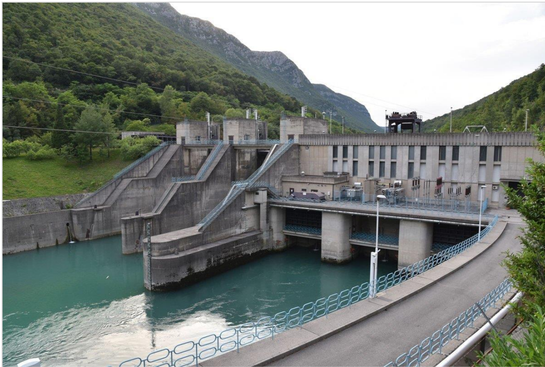
HE na Savi