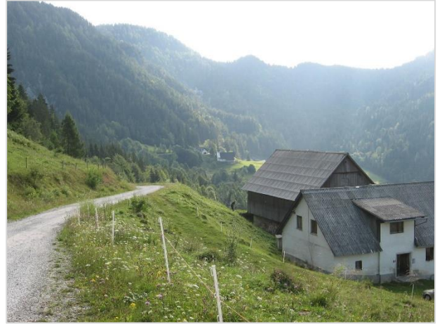
Samotna kmetija pod Olševo