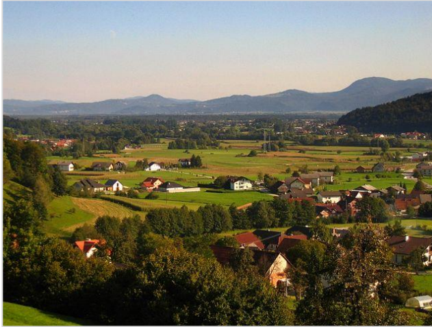
Razloženo naselje v dolini Gradašnice

(→ gručaste vasi; na slemenih in prisojnih območjih: samotne kmetije in zaselki; osojna pobočja so neposeljena).