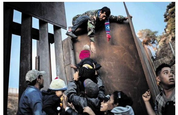
Slika 7 in Slika 8: Številni mehiški prebežniki poskušajo preplezati mejni zid med Mehiko in ZDA.