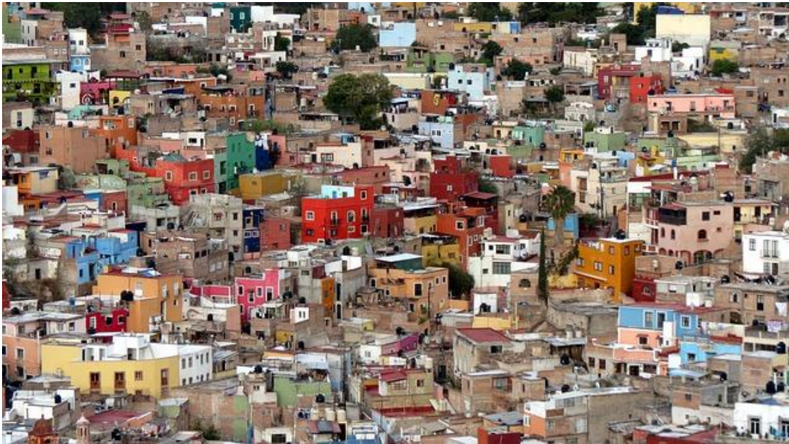
Slika 2: Barakarska naselja v Mehiki

Oglej si nekaj fotografij, ki predstavljajo naravno in kulturno pestrost Srednje Amerike.