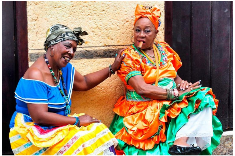
Slika 10: Kubanki v tradicionalnih kubanskih oblačilih