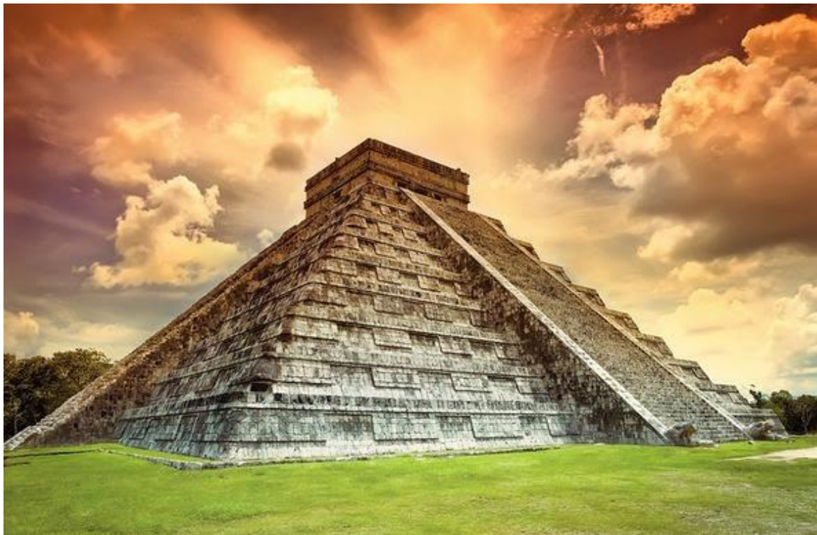
Slika 3: Mehika je zibelka srednjeameriških civilizacij Majev in Aztekov.