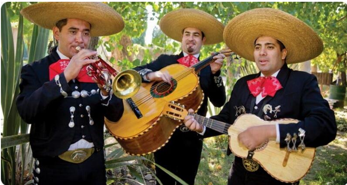
Slika 5: Mariachi – mehiški glasbeniki