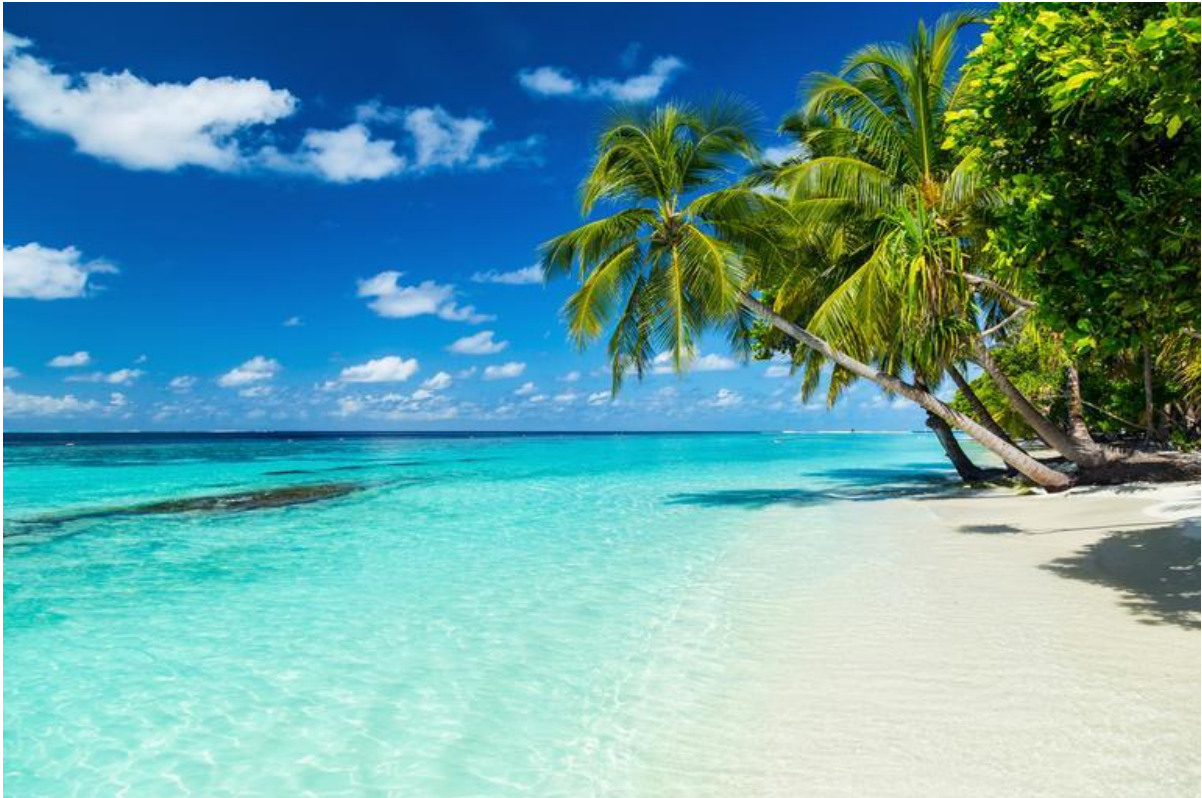
Slika 4: Sanjska plaža na enem od Karibskih otokov