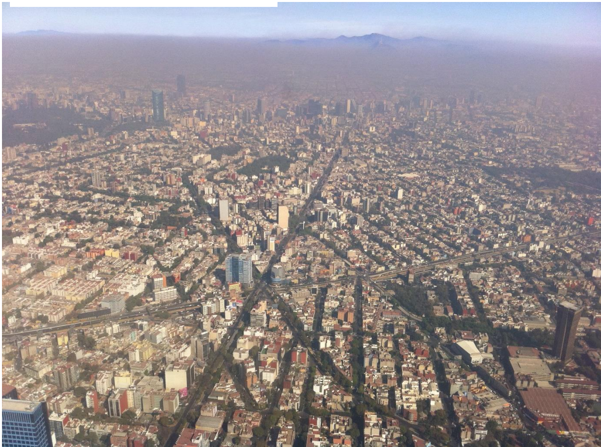
Slika 11: Mehška prestolnica Mexico City (mesto z okolico šteje 21, 2 milijona prebivalcev)