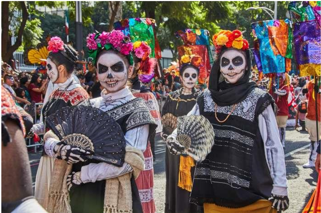
Slika 6: Praznovanje dneva mrtvih v Mehiki