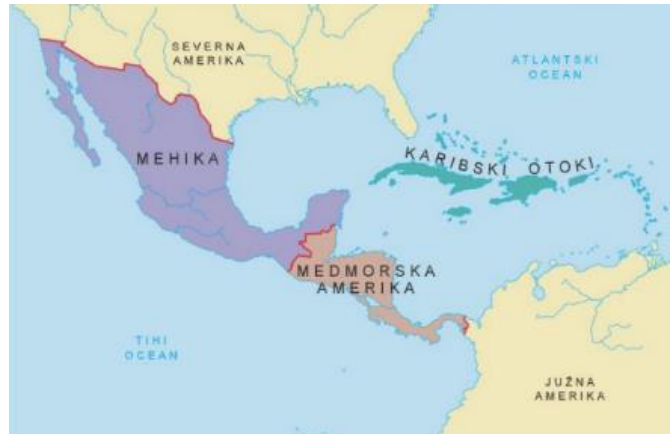
Slika 1: Geografska lega Srednje Amerike