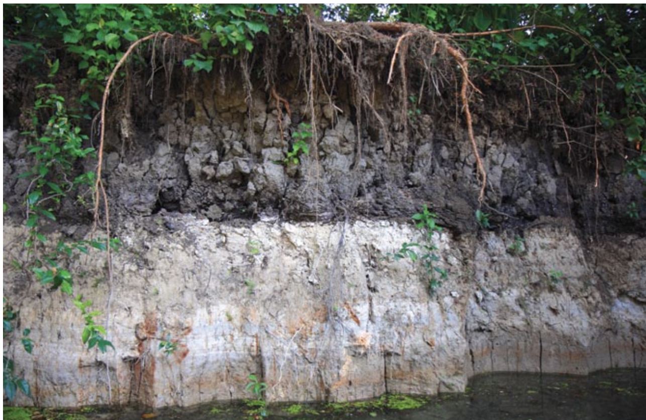
Slika 2: Prerez skozi barjansko tla.

Ljubljansko barje je bilo do začetka 19. stoletja, ko so se začeli večji osuševalni posegi, v razmeroma naravnem stanju. Večino barjanske ravnine je sestavljalo nizko oziroma travnato in visoko oziroma mahovno barje. Suhi travniki, pašniki, vrtovi, njive in sadovnjaki so se razprostirali le na obrobju Barja, v osredju barjanske ravnine so bile njive le na osamelcih (9, 2). Z izjemo barjanskih osamelcev je bilo Ljubljansko barje pred začetkom osuševalnih del neposeljeno. V gospodarskem pogledu je bilo neznatne vrednosti; še največ so ga izkoriščali lovci. V tem času na Barju ni bilo niti "pravega" gozda. Po travnatem površju so rastle le posamezna drevesa, predvsem jelše in vrbe, redkeje breze. Površje visokega barja so poraščala redka nizka drevesa breze, bora, brogovite in vrbe (9, 2). Takratno visoko barje je bilo edino visoko barje na območju Slovenije na tako nizki nadmorski višini in tudi najjužnejše visoko barje v Evropi. Njegovo izginotje so povzročile človekove dejavnosti, predvsem rezanje šote, osuševanje in spreminjanje mokrotnih zemljišč v kmetijska.