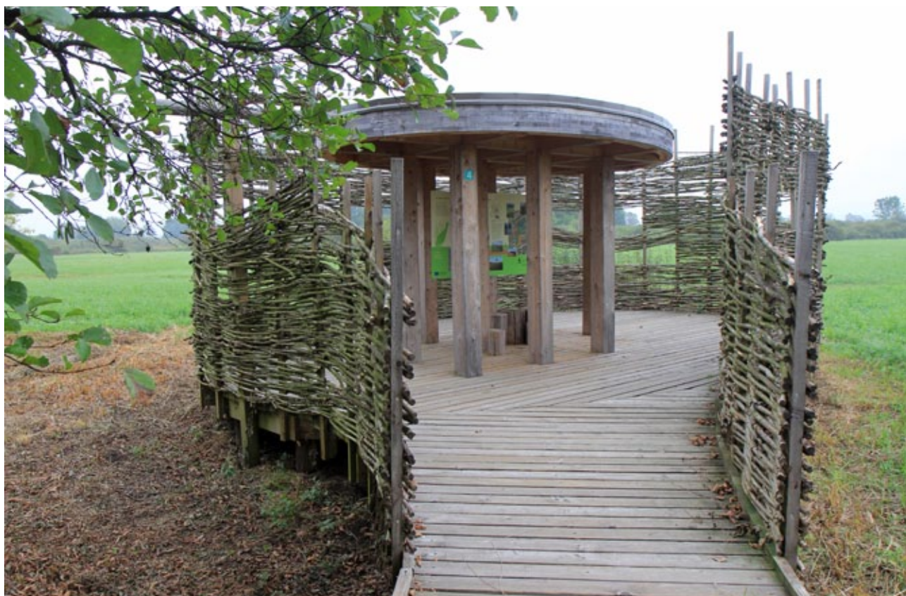
Slika 5: Na Ljubljanskem barju nastaja mreža interpretativnih vsebin.

Zato je eden od namenov zavarovanih območij prav interpretacija naravnih vrednot in kulturne dediščine; namenjena mora biti tako lokalnemu prebivalstvu kot obiskovalcem. Turizem in rekreacija prinašata na takšnih območjih številne vplive na ekosisteme, tako pozitivne kakor tudi negativne. Ključna