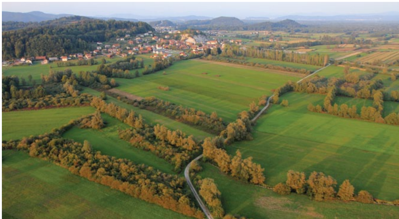
Slika 1: Prepletanje življenjskih okolij na Ljubljanskem barju.

Na južnem robu Barja iz več kraških izvirov izvira reka Ljubljanica, ki ne prinaša velikih količin naplavin. Nekraški pritoki, predvsem Iška na jugovzhodu in Gradaščica na severu, pa so nasuli obširne vršaje, tako da je površje Barja najnižje v sredini in se postopoma dviguje proti robovom. Ljubljanica je v barjanske naplavine vrezala več metrov globoko strugo, vendar ima pri svojem 20 km dolgem toku izredno majhen padec (dno struge pri Verdu je na nadmorski višini 285,31 m, pod Tromostovjem v Ljubljani 284,00 m), kar povzroča stalne poplave (4).