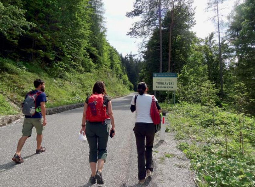
Slovenci imamo v splošnem pozitivno mnenje o Triglavskem narodnem parku.