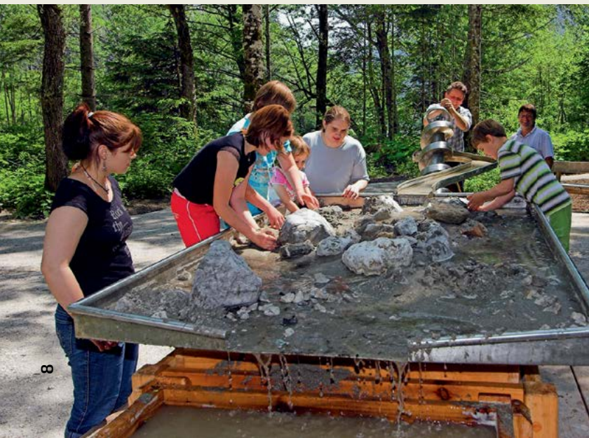
Spoznavanje procesov v naravi s pomočjo modeliranja