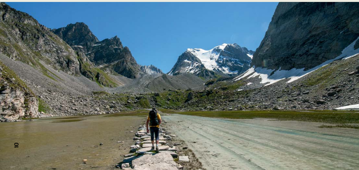
V osrčju narodnega parka Vanoise, v ozadju Grande Casse