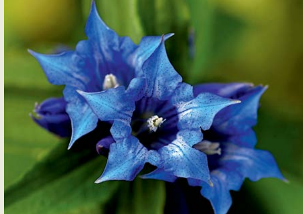
Svilničevolistni svišč ali svečnik ( Gentiana asclepiadea )