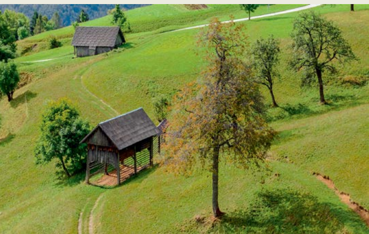
Travniki pod vasjo Podjelje v Bohinju; Triglavski narodni park