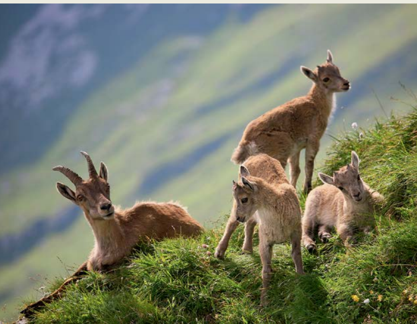
Družina kozorogov; Triglavski narodni park