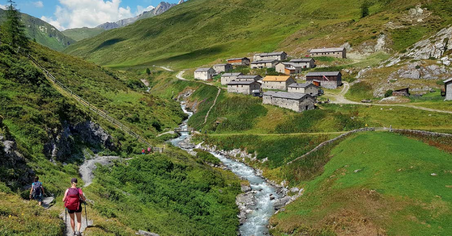
Planino Jagdhausalm (narodni park Visoke Ture) zaradi kamnitih hiš imenujejo tudi "tibetanska vas".