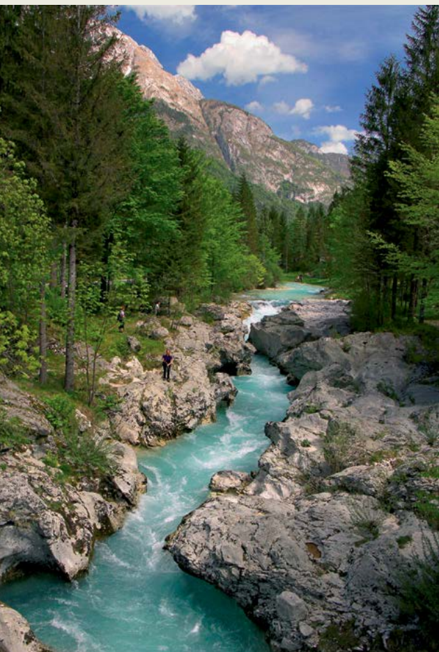
Korita Soče v Triglavskem narodnem parku

človeka in v katerem so prepovedane vse gospodarske dejavnosti, razen tradicionalnega gorskega pašništva, dopustne so tudi znanstvene raziskave in obiskovanje območja pod določenimi pogoji. V robnih območjih so dopustne tradicionalne gospodarske dejavnosti (gospodarjenje z gozdovi, kmetijstvo, lov, ...).