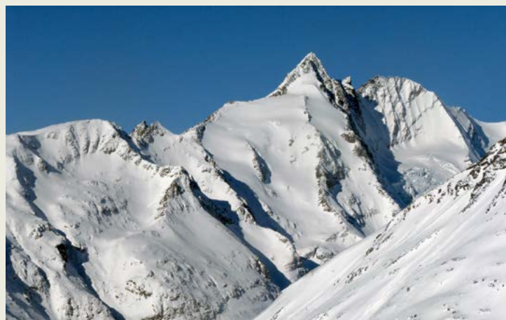
Grossglockner; narodni park Visoke Ture