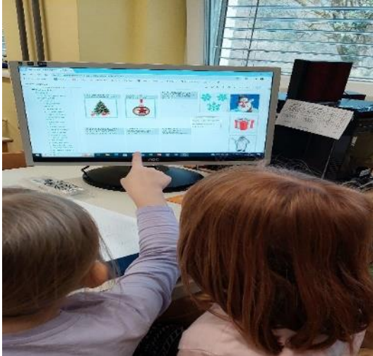
H5P Drag & Drop: NOVOLETNE UGANKE