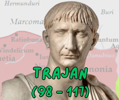
TRAJAN (98 - 117)

V NJEGOVEM ČASU JE CESARSTVO DOSEGLA NAJVEČJI OBSEG.