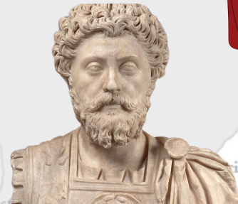
MARK AVRELIJ (161 - 180)

RIMSKO CESARSTVO DOŽIVI VIŠEK GOSPODARSKE MOČI, UBRANIL MEJE PRED GERMANI