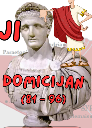
DOMICIJAN (81 - 96)

SPRVA DOBER VLADAR, NATO POSTANE ZLOBEN, PREGANJAL KRISTJANE.