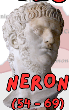
NERON (54 - 69)

SPRVA DOBER VLADAR, NATO POSTANE ZLOBEN, PREGANJAL KRISTJANE.