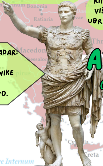
AVGUST (27 PR. KR. - 14)

AVGUST JE BIL SPOSOBEN VLADAR: • OBNOVIL JE RIM. • GRADIL STAVBE IN SPOMENIKE PO VSEJ DRŽAVI. • RAZŠIRIL IN UTRDIL DRŽAVO.