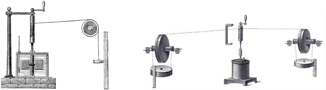
Slika 2: Dve napravi, s katerima je James P. Joule 1845 določil mehanski ekvivalent toplote.

Če telo oz. snov z okolico izmenjuje delo in toploto , spremembo notranje energije zapišemo takole: