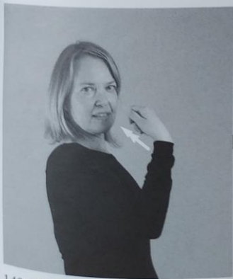
149 DIETA 149/1 jesti