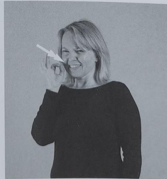
126 KISLO 126/1 zoprno