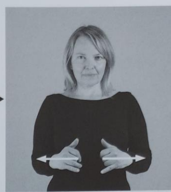
160 ŠTRUCA 160/1 oblika