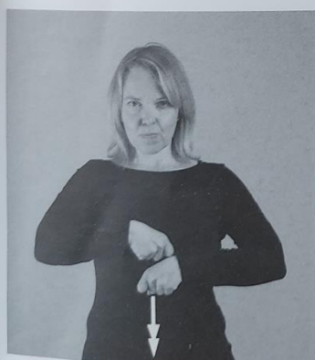
110 POŽERUH 110/1 tlačiti