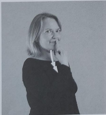
125 SLADKO 125/1 bonbon