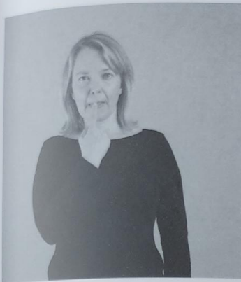
128 SLANO 128/1 okus