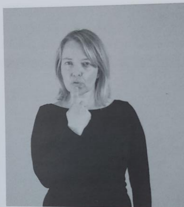
188 SOL 188/1 okus