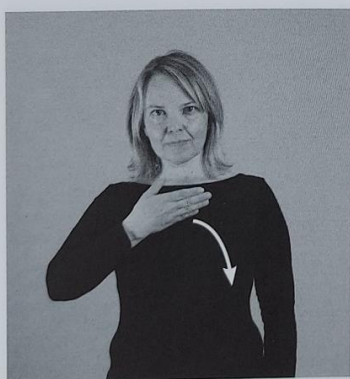
115 VEČERJA 115/1 noč