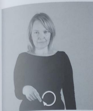
158 HLEBEC 158/1 okroglo/krog