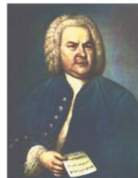
Johann Sebastian Bach

Iz glasbene zgodovine je najbolj znana nemška glasbena družina Bach . Oče Johann Sebastian je imel dvajset otrok in veliko od njih se je ukvarjalo z glasbo.