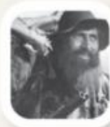
divji lovec Bedanec