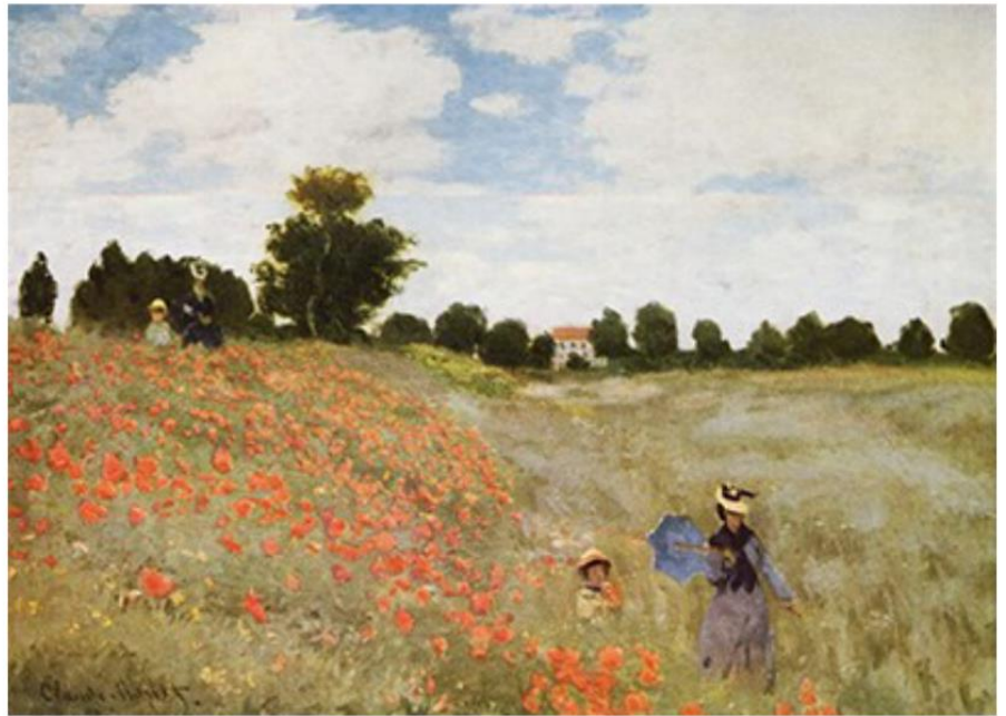
NEURBANA krajina: Claude Monet, Cvetiče makovo polje, 1873