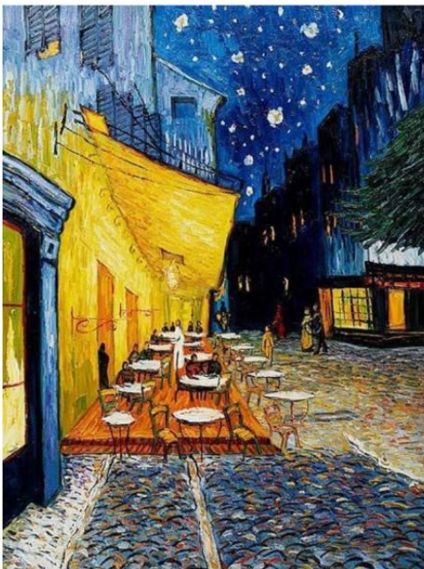
URBANA krajina: Vincent van Gogh, Cafe Terrace ponoči, 1888

2. O KRAJINI ali PEJSAŽU govorimo, kadar je na upodobitvi (risbi, sliki, grafiki) najpomembnejša pokrajina. Motiv lahko prikazuje mesta, trge, ulice ( urbana krajina ) ali naravno pokrajino ( neurbana krajina ).