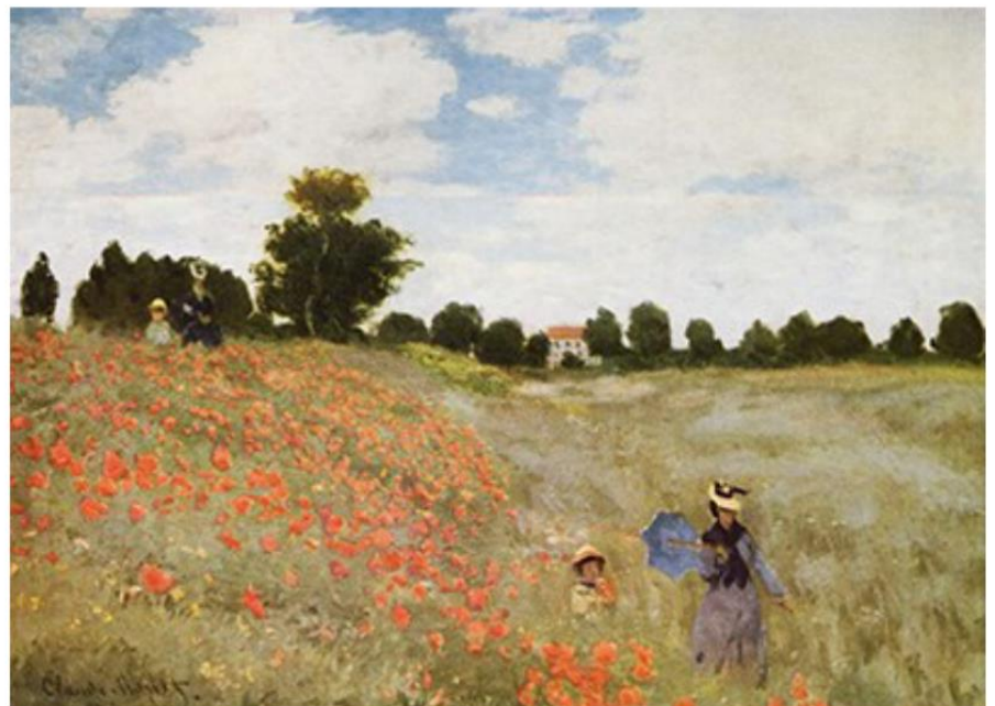
NEURBANA krajina: Claude Monet, Cvetiče makovo polje, 1873