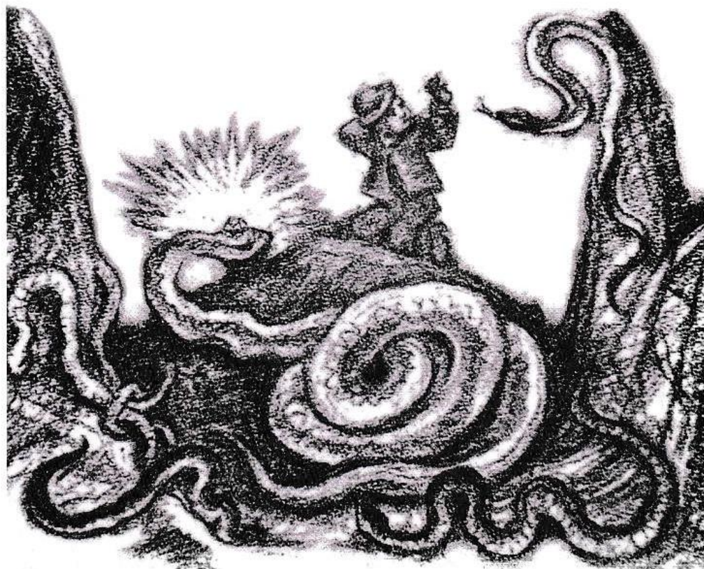
Ilustracija: Maksim Gaspari