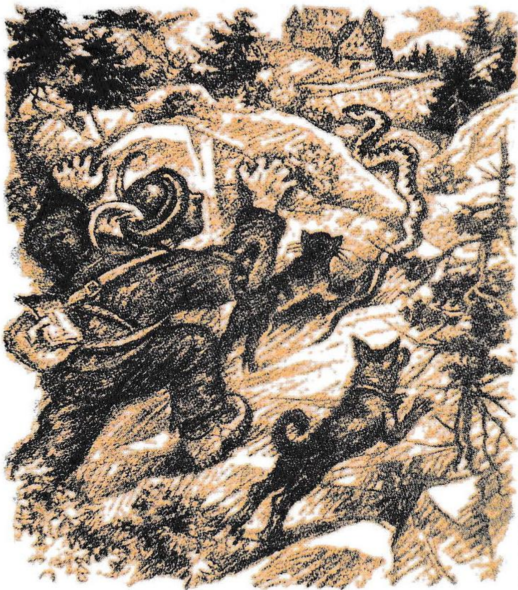
Ilustracija: Maksim Gaspari