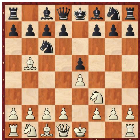
ŠPANSKA OTVORITEV (Ruy Lopez)