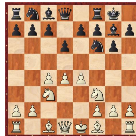
KRALJEVA INDIJSKA OBRAMBA