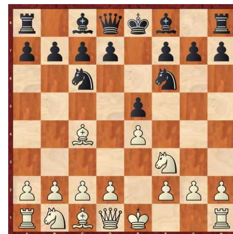
OBRAMBA DVEH SKAKAČEV