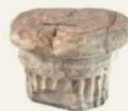
okoli 1000 n. št.