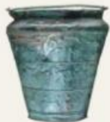
okoli 2000 pr. n. št.