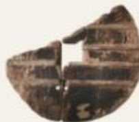
okoli 3000 pr. n. št.