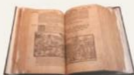
1550 n. št.