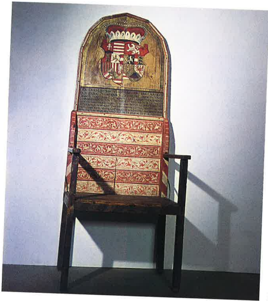
▲ Stol z grbom notranjeavstrijskih dežel. Na njem je nadvojvoda Karel II. 1564 sprejel dedni poklon kranjskih stanov. (Narodni muzej v Ljubljani)