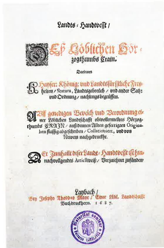
▲ Landts-Handtvestt des Löblichen Hertzogthums Crain. Deželni ročin vojvodine Kranjske – zbirka deželnih plemiških privilegijev – je bil natisnjen v Ljubljani 1687.

Sprva so na deželnih zborih skušali zagotoviti dovolj sredstev za oblikovanje nove vojaške organizacije. Štajersko, Koroško in Kranjsko – od začetka 15. st. so to skupino habsburških dednih dežel imenovali Notranja Avstrija – so namreč pretresali številni spori in vojaški spopadi, predvsem zaradi dinastičnih nesoglasij v "habsburški hiši" ter rivalstva med Habsburžani in Celjskimi grofi oz. knezi, ki je trajalo vse do sklenitve dedne pogodbe med tema dvema rodbinama (1443). Nevarnost pa je grozila tudi od zunaj: na zahodu od Beneške republike, ki je po 1420 – po zlomu oglejskega patriarhata – razširila svojo posest na Furlanijo, Beneško Slovenijo in Tolminsko ter na Milje v Tržaškem zalivu, na jugu pa od Turkov, ki so v 15. st. naglo osvajali Balkan. Ob večjih roparskih pohodih na Ogrsko in Hrvaško so Turki vdrli tudi