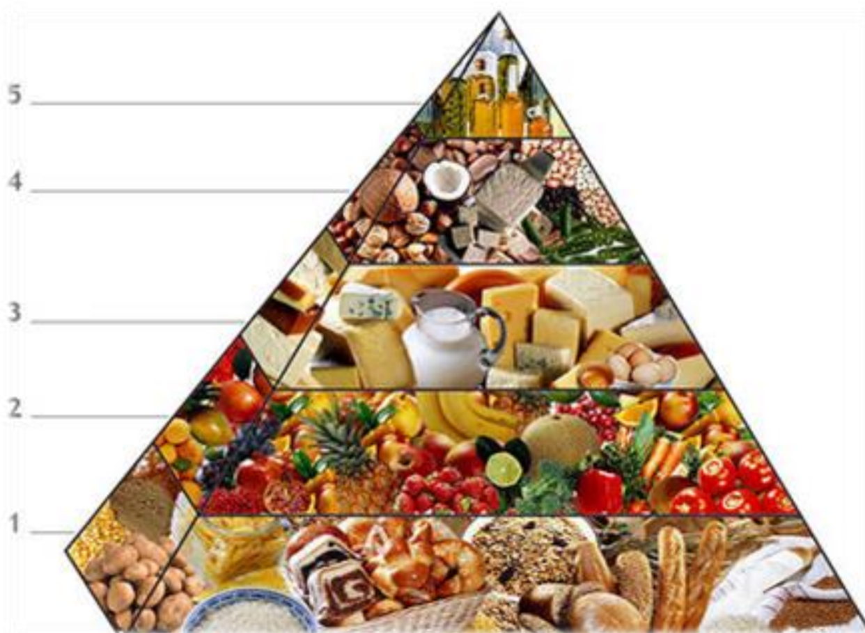
VEGETARIJANSKA PIRAMIDA PREHRANE