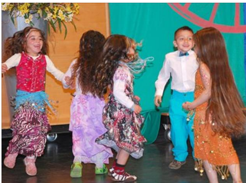
Ples romskih otrok