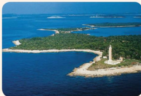
Obala Jadranskega morja

Jadransko morje je dolg in širok zaliv Sredozemskega morja, ki deli Apeninski polotok od Balkanskega polotoka. Njegova modrina je resnično utelešenje najboljših delov Sredozemlja. Bistrina na kopnem sega celo do 56 m. Globina morja na severu je okoli 50 m, medtem ko je pri Palagruži morje globoko do 250 m. Pri najbolj oddaljenem otoku Jabuka se globina spusti do 1.300 m. Povprečna temperatura morja je poleti od 22 do 27 stopinj Celzija, medtem ko je najnižja zimska temperatura 7, spomladi pa prijetnih 18 stopinj Celzija.