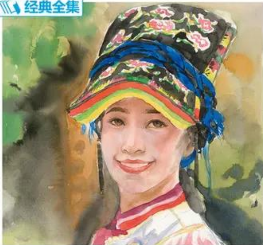
中国美院名师 水彩人物教程