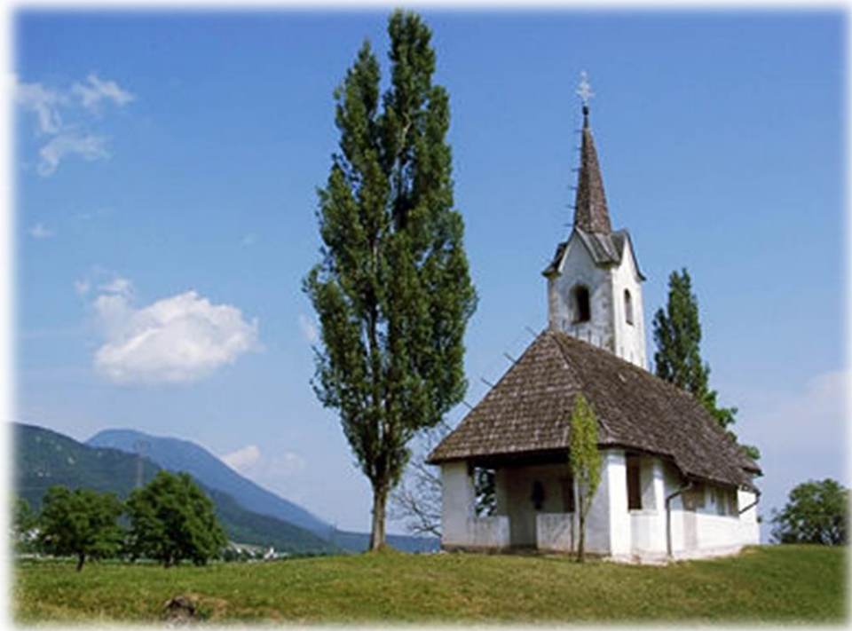
Cerkev sv. Marka v Vrbi na Gorenjskem

S pomočjo posnetka ponovimo, kaj vse smo danes izvedeli o dr. Francetu Prešernu.