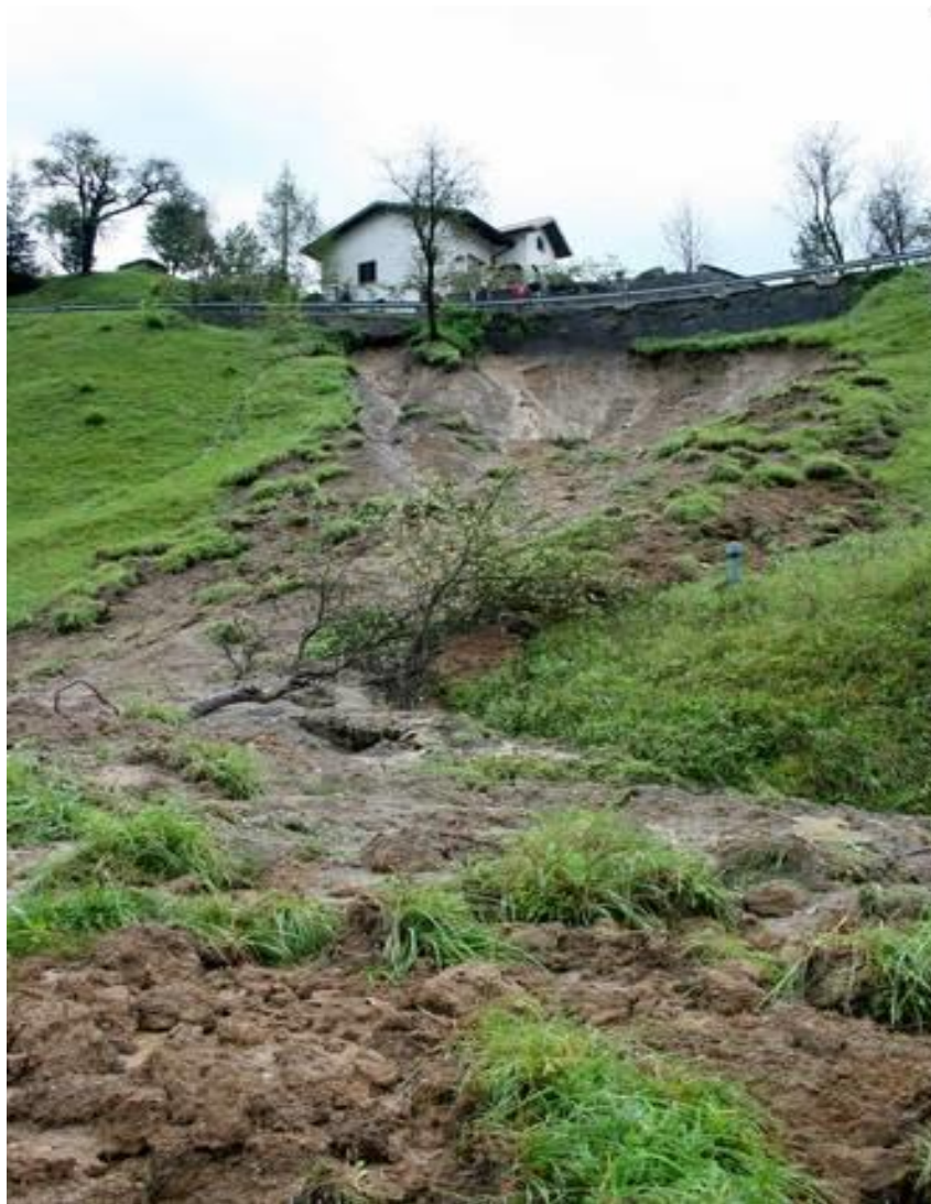
Usad – manjši zemeljski plaz

S sabo odnesejo vse, kar stoji na njih, in zasujejo, kar jim je na poti. To se navadno dogaja, kadar obilno dežuje.