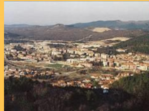
Sežana – mesto je središče Krasa