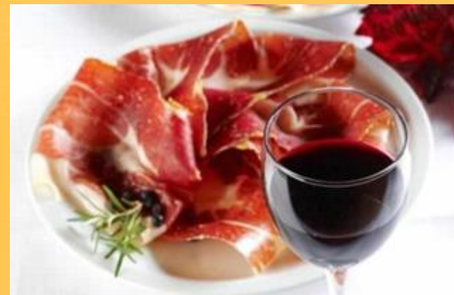
kraški pršut in teran