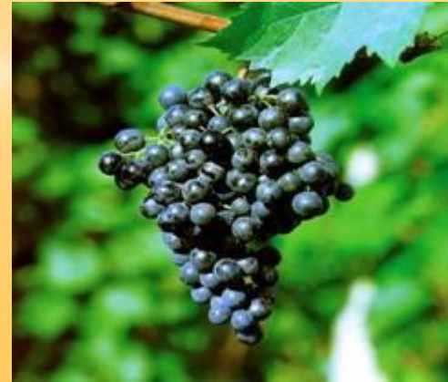
sorta grozdja REFOŠk, iz katere izdelujejo vino TERAN