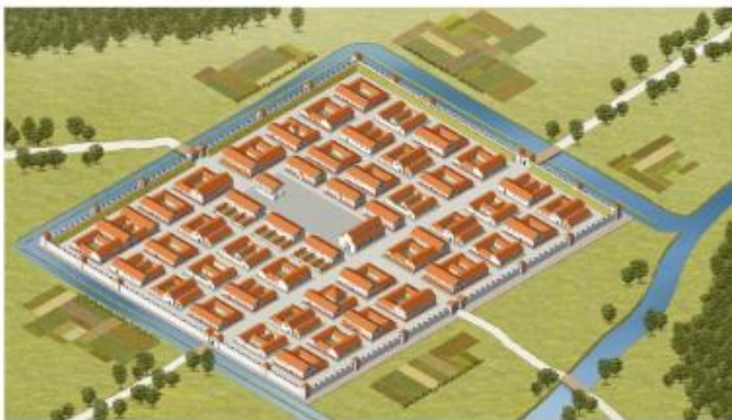
mesta so bila obdana z obzidjem

Prišli so tudi gradbeniki, ki so vojaške tabore z gradnjo spreminjali v mesta, gradili so ceste, vodovod, kanalizacijo, kopališča, palače, amfiteatre,..