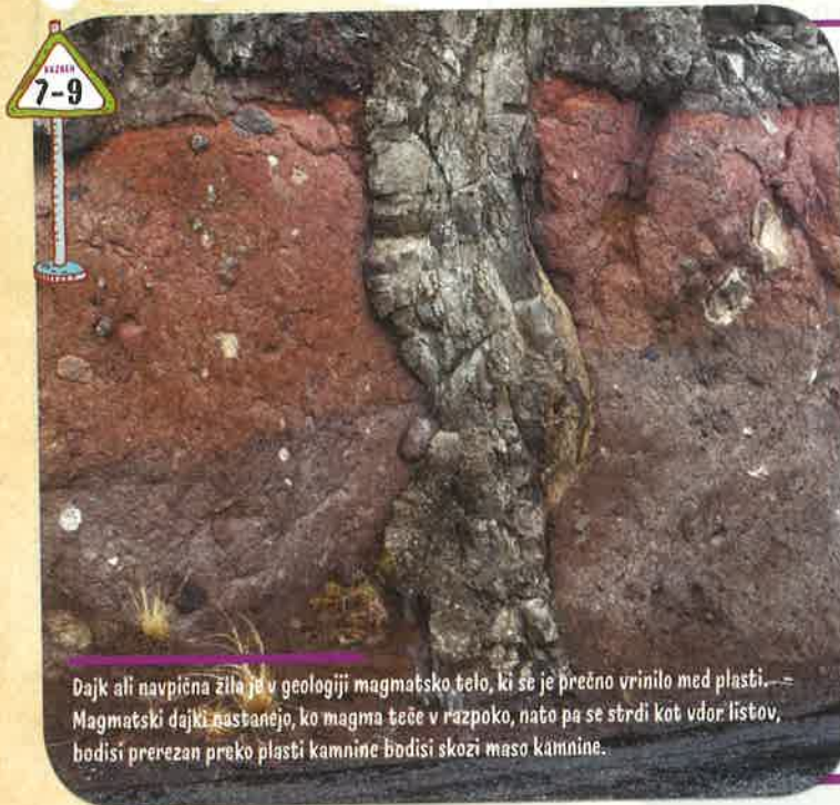
Dajk ali navpična žila je v geologiji magmatsko telo, ki se je prečno vrinilo med plasti. Magmatski dajki nastanejo, ko magma teče v razpoko, nato pa se strdi kot vdor listov, bodisi prerezan preko plasti kamnine bodisi skozi maso kamnine.

Večina svetovnih vulkanov leži vzdolž robov plošč. Najbolj dejaven ognjeni obroč poteka po obrobju Tihega oceana vzdolž Andov in vse do Aljaske ter od Japonske navzdol do Nove Zelandije.