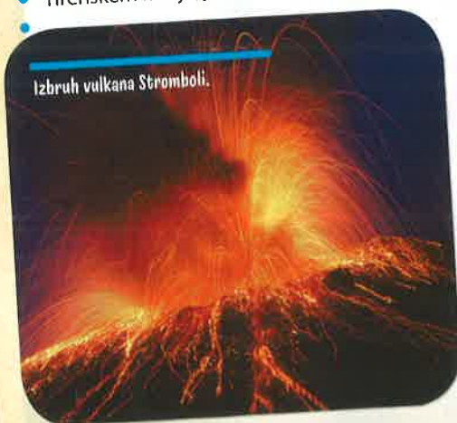
Izbruh vulkana Stromboli.

Ravno pred kratkim, 9. 12. 2019, je izbruhnil vulkan na novozelandskem Belem otoku (imenovanem tudi Whakaari), ki velja za zelo priljubljeno turistično točko. V času izbruha je bilo na otoku kar nekaj izletnikov, saj je tam pristala križarka. Tragedija se je žal končala tudi s smrtnimi izidi. Vulkani so s svojimi lepotami zelo priljubljene izletniške točke, a tudi izjemno nevarni. Če boste kdaj letovali v bližini kakšnega vulkana, previdnost