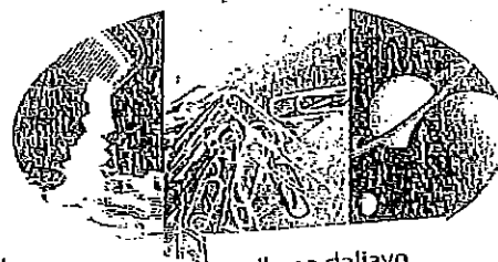
sile na daljavo

b) Osnovna merska enota za silo je _____, ki jo označujemo s črko _____. Oznaka za silo je črka _____. Silo ponazorimo z vektorjem (usmerjeno daljico). Natanko jo določajo: _____, _____ in _____.