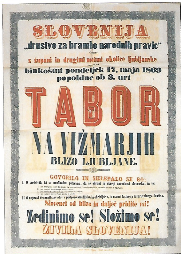
Na vižmarski tabor so vabili tudi s posebnimi plakati.