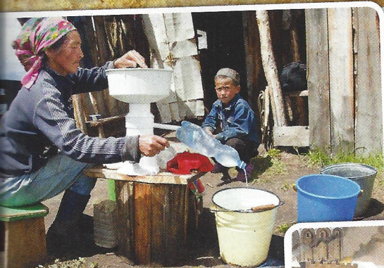
Mongoli so še danes madški narod.

Bili so predvsem vrhunski jezdeci in lokostrelci. Ljudstvo travnatih planjav je spremenilo tok zgodovine. Med 12. in 14. stoletjem so ustvarili imperij – veliko svetovno državo, ki je na vrhuncu moči segala od Jadranskega morja do Tihega oceana, od Tibeta do Sibirije.