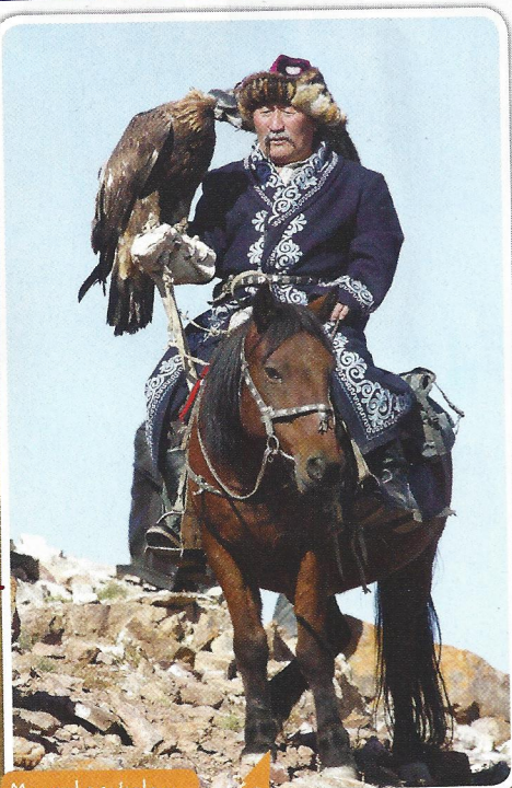
Mongol s sokolom

Čez Mongolijo so potovale trgovske karavane po svilni cesti iz Evrope na Kitajsko. Od tukaj so preprosti pastirji v srednjem veku odjezdili na največji osvajalni pohod celotne zgodovine. Samo tri stvari so potrebovali, da so segli k svetovni slavi: konje, krut pogum in vodjo – sposobnega junaka. Živel so od živinoreje, lova in trgovine. Ste v kitajski restavraciji že jedli mongolsko meso na žaru? Odlično je, kajne? Mimogrede, Mongoli so premagali tudi Kitajsko in na pohodih so imeli svoje meso spravljenno – pod sedlom. Praktično, kajne? Po nekajdnevni ježi se je dobro zmeščalo.