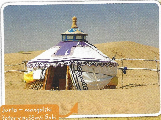
Jurta – mongolski šotor v puščavi Gobi