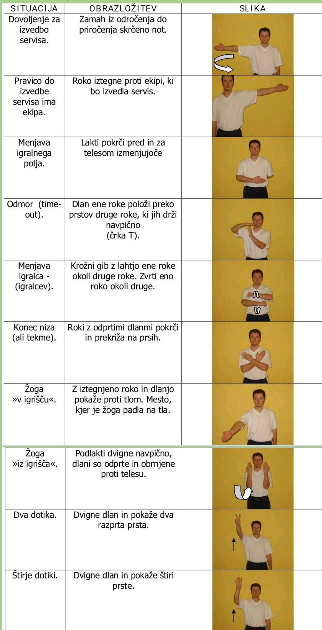
TABELA 1: Šodniški znaki