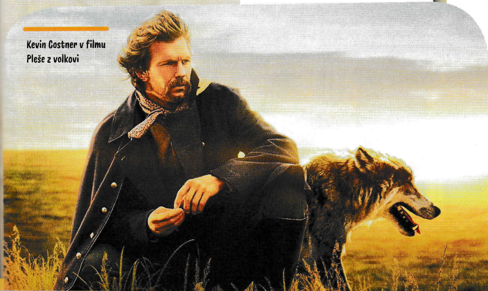
Kevin Costner v filmu Pleše z volkovi

prebrala njegovo protestno pismo. Kevin Costner je posnel film Pleše z volkovi, ki je z resnico osupnil Ameriko. In ne pozabimo, že mnogo prej je nemški pisatelj Karl May v znameniti trilogiji Vinetou prvotne prebivalce Amerike pošteno prikazal kot ljudi, ki so samo branili, kar jim je pomenilo največ – svoj način življenja in svojo zemljo.