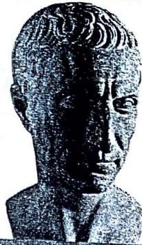
JVLJ CEZAR (100–44 pr. Kr.)