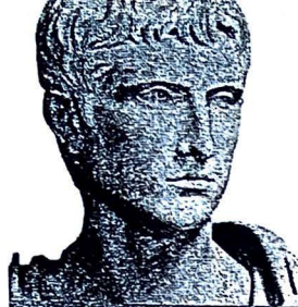
AUGUSTIN AVGVST (63 pr. Kr. – 14 po. Kr.)