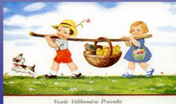
Vesele Velikonočne Praznike