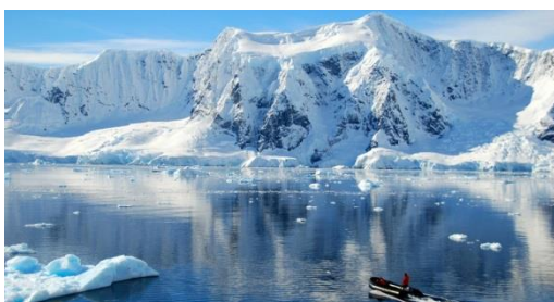
VEČNI LED IN SNEG pokrajina ledu (zmeraj je pod 0°C)