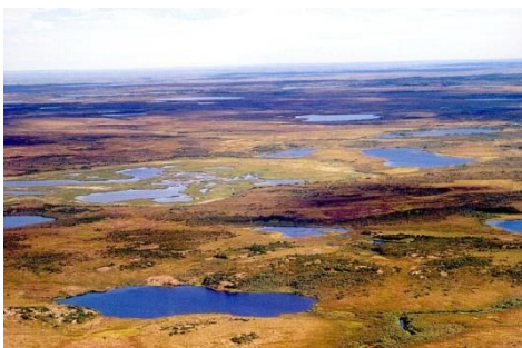
TUNDRA pokrajina mahov in lišajev