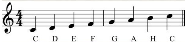
Poimenovanje tonov po sistemu črk.

Ton lahko zapojemo ali zaigramo. Zapišemo jih z notami, te pa zapišemo v notno črtovje. Vsaka nota ima svoje ime. Imena zapisujemo s črkami ali solmizacijskimi zlogi.