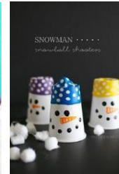
Snežak iz jogurtnega lončka.