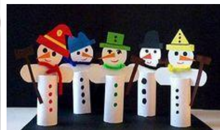
Sneženi možje iz tulca od toaletnega papirja.