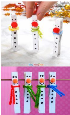
Snežaki na ščipalki za perilo in