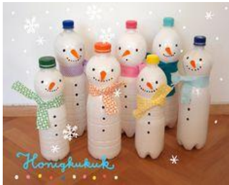
Sneženi mož iz plastenke.