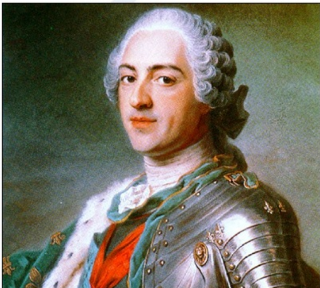
Ludvik XV. je zasedel prestol, ko je bil star komaj pet let