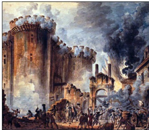
Napad na trdnjavo Bastiljo velja za prelomno dejanje, saj je bila trdnjava simbol kraljeve absolutistične vladavine. Uporniki so razorožili vojake v trdnjavi in osvobodili zapornike. Trdnjavo so do novembra 1789 popolnoma porušili, danes pa na njenem mestu stoji Place de la Bastille, na njem pa Bastiljska operna hiša.

Kralj je poskušal z vojsko ponovno prevzeti oblast in v Parizu se je zgodila Bastilja.