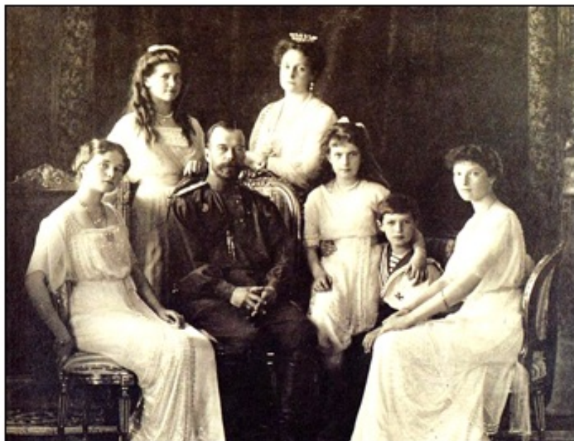
Ruski car Nikolaj II. z družino

Nemška vlada in vodstvo nemške vojske je vzdrževalo stike z revolucionarnimi skupinami ruskih emigrantov, predvsem boljševiki. Želeli so pospešiti revolucijo in s tem oslabilo antanto. Revolucijo so pospeševali vojaški porazi carske vojske. V tem času se je sesula tudi vsa logistika (npr. oskrba z orožjem, strelivom, vzdrževanje vojne industrije, oskrbo mestnega prebivalstva z živili).