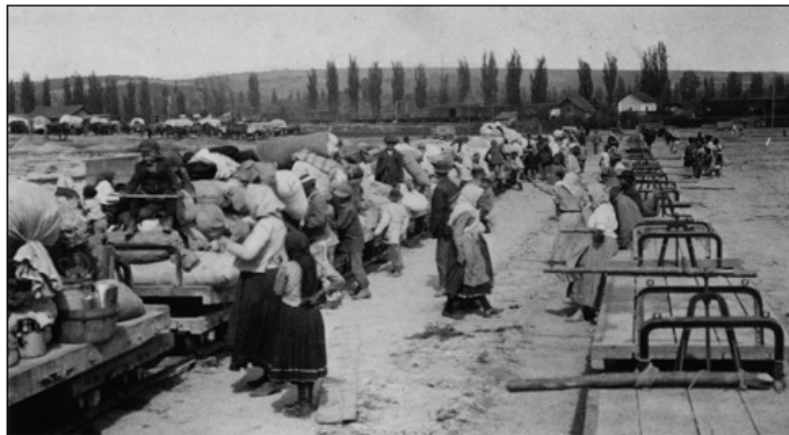
Številni Rusi so morali zaradi vojne zapustiti svoje domove in se izseliti.