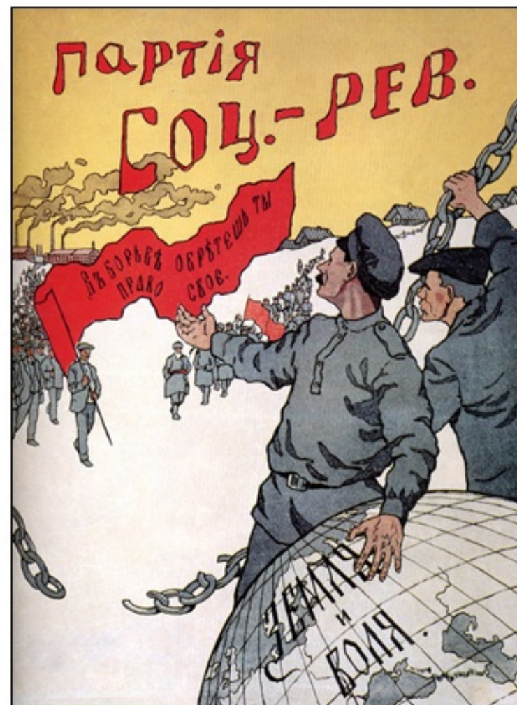
Volilni poster sovjetskih revolucionarjev leta 1917

Oblast so prevzeli in jo v tri leta trajajoči vojni prevzeli boljševiki. Vladali so v imenu delavcev, a brez njihovega pooblastila.