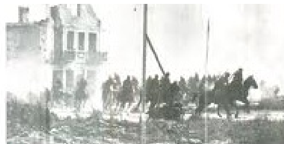
Vir C: Poljska konjenica med umikom 1. septembra 1939 je poljsko konjenico, ki je štela 70 000 konjenikov, napadla nemška tankovska enota. Nacisti so to prikazali, kot da Poljaki s konjenico napadajo tanke.

Velika Britanija in Francija sta držali besedo o pomoči, ki sta jo dali Poljski, in 3. septembra napovedali Nemčiji vojno. Toda njune enote so čakale v okopih na svoji strani nemško-francoske meje. Ko je čez dva tedna vdrla na Poljsko še Rdeča armada, je bilo poljskega odpora konec. Nemčija in Sovjetska zveza sta si Poljsko razdelili skladno s tajnim delom pogodbe.