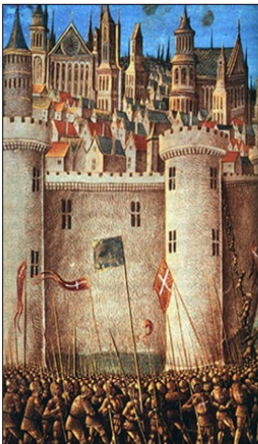
Križarji oblegajo Antiohijo.