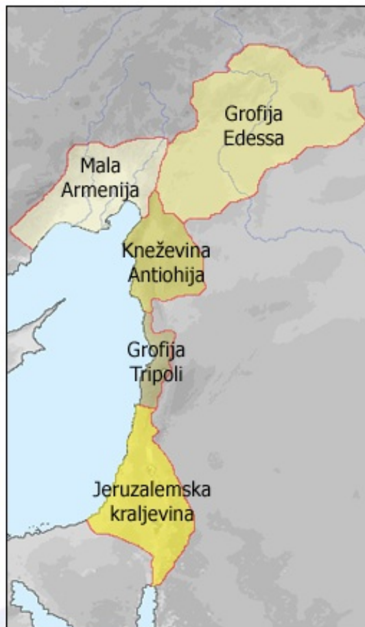
Na novo nastale državice.

Po uspešnem vojaškem pohodu si krščanski vitezi razdelijo zasedeno ozemlje.