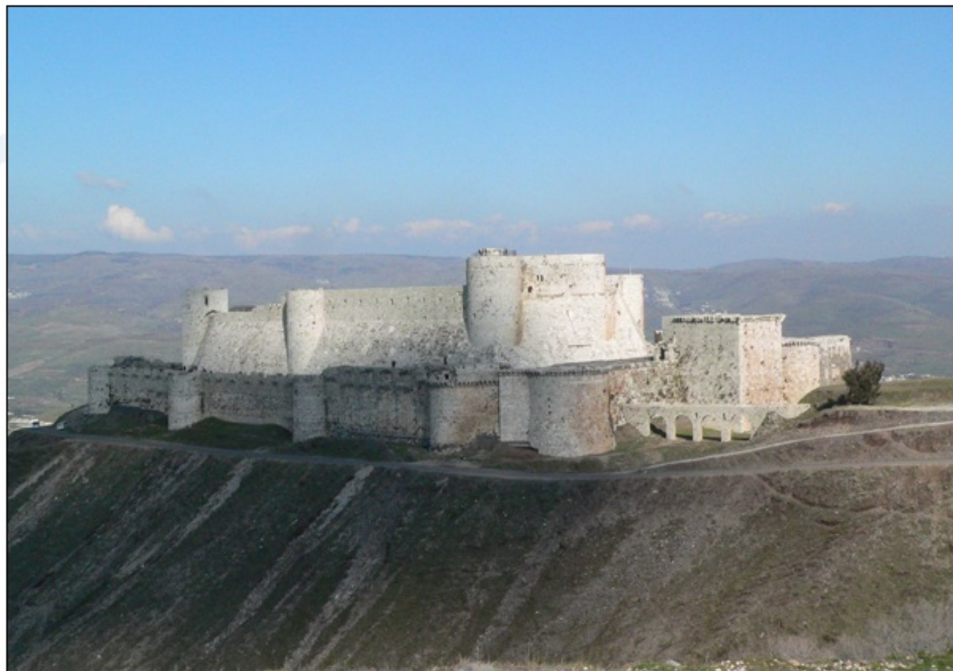
Trdnjava Krak des Chevaliers (v Siriji), ki so jo zgradili križarji.

Zaradi križarjev in njihovih pohodov so postali sladkor, svila, žamet in steklena zrcala cenejši. Najpomembnejši posrednik med Vzhodom in Zahodom so postali Benečani. V tem času so Evropejci ceneje dobili agrume, začimbe, slonovino, steklo, diamante in žad. V matematiki se je po križarskih vojnah vse bolj uveljavljal desetiški sistem. Velik je bil tudi vpliv na arhitekturo; graditi so začeli večje gradove, ki so bili tudi bolj luksuzno opremljeni. Evropejci so se seznanili z bolj naprednimi metodami zdravljenja.