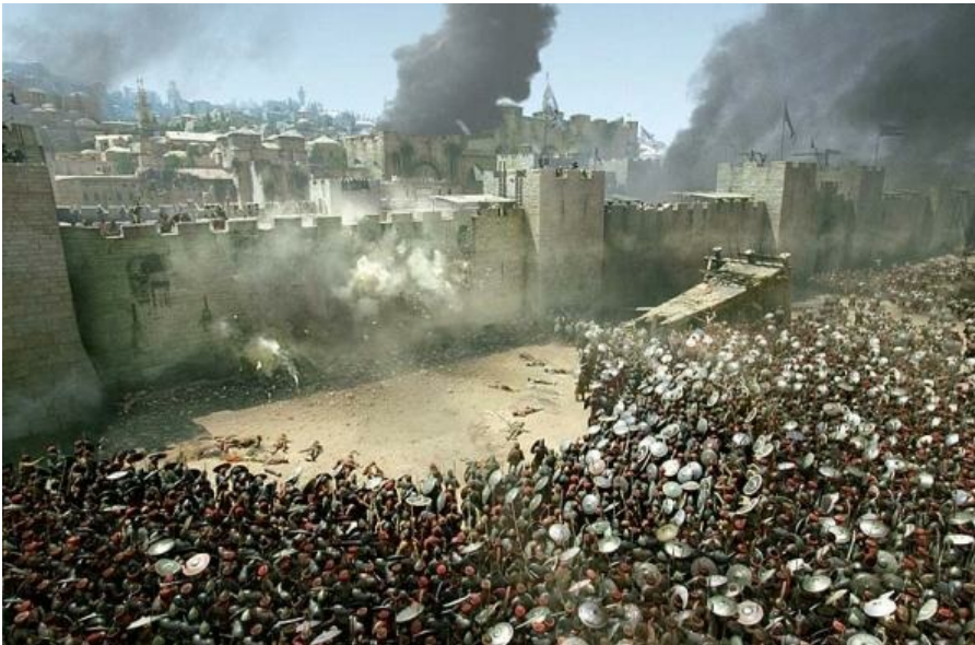
Saladin oblega Jeruzalem

Vojaški pohodi krščanskih vojsk so bili neuspešni saj je vzhodno Sredozemlje in s tem Palestina in sveti kraščanski kraji ostali pod nadzorom muslimanov, bodisi Turkov oziroma Arabcev.